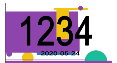
Figuur 2: Voorbeeld Match Image