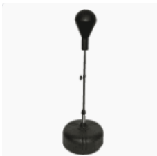
Voorbeeld 2: Staande boksbal