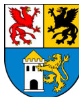
Starostwo Powiatowe w Lęborku