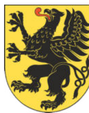
Urząd Marszałkowski w Gdańsku